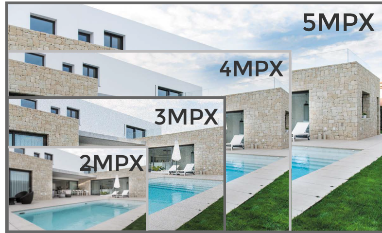
*Referencia de Imagen