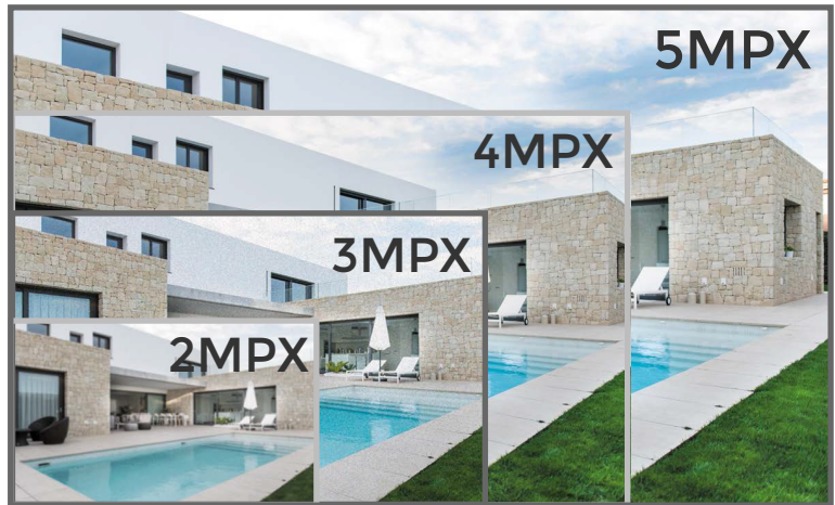
*Referencia de Imagen